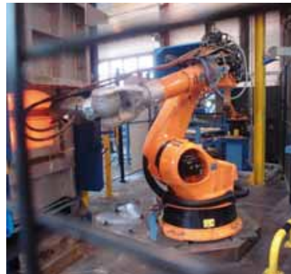
Presse robotisée Automated forging press line