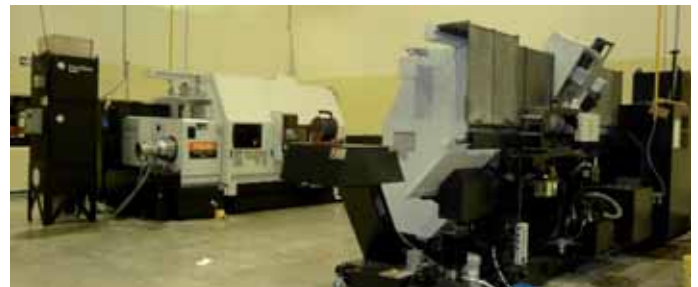
Chihuahua – Mexique : unité d'usinage et de surface - Opérationnelle depuis novembre 2008 Chihuahua – Mexico: 4 machining centers are running in production in this new workshop