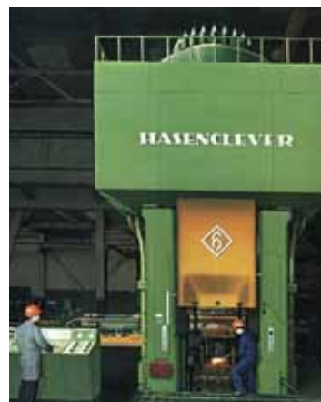
Presse à vis 6 300 t 6,300 t screw press