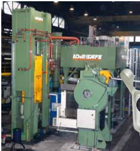
Presse hydraulique rapide de 1 500 t 1,500 t hydraulic press

Forge + Usinage + Assemblage = Produits finis Forging + Machining + Assembling = Finished products