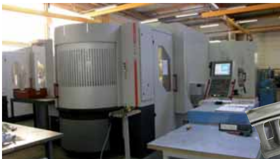
Usinage de précision sur centre 5 axes 5 axis machining process