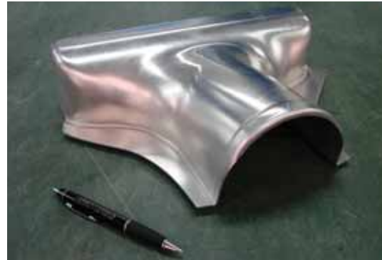
Hydroformage - Flexforming